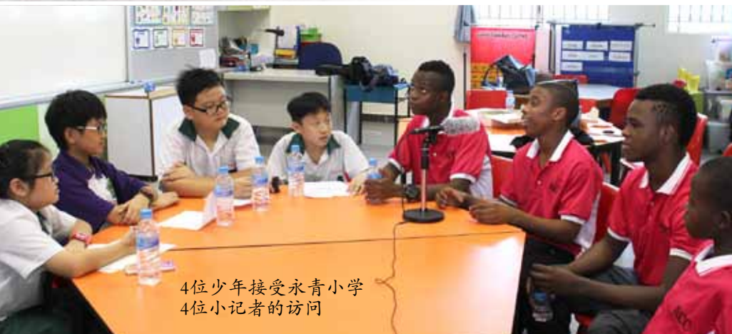
4位少年接受永青小学4位小记者的访问