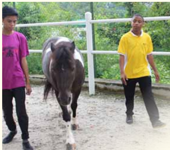
通过与马儿的互动，学习“尊重”应不分彼此

接着我们开始表演节目。我们唱了歌，还念了唐诗。最后，我们表演功夫。同门都看得津津有味，送给我们热烈的掌声。我今天学会一个很有趣的游戏——五个石头。这个游戏是考验我的反应能力。我又要向上扔石头，又要快速抓石头，非常不容易，我玩得不亦乐乎。