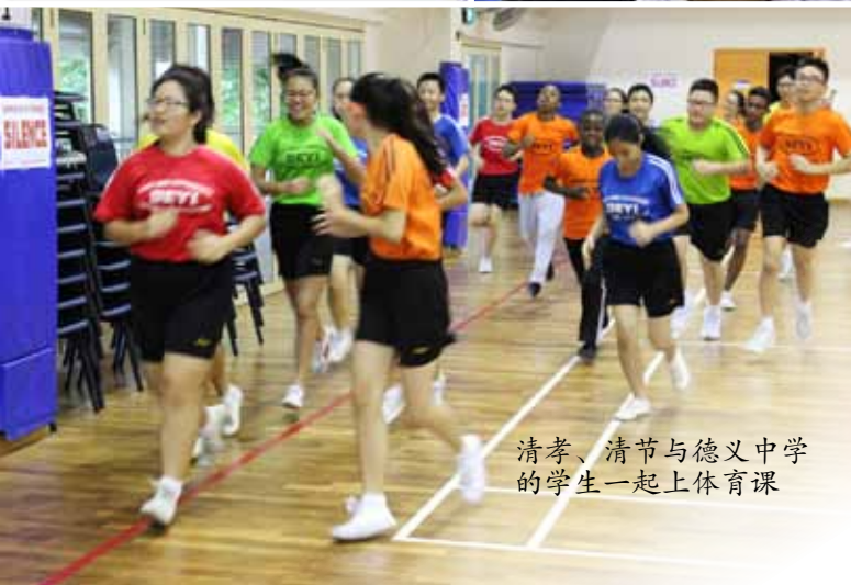
清孝、清节与德义中学 的学生一起上体育课