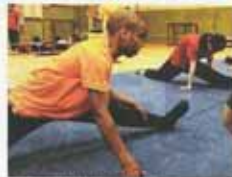
青年们在训练场上施展武艺，人人身手敏捷，动作利落犹如灵猴。

“不少本地学生学华文时都只为应付考试，希望他们从非洲学生分享中，体会到自己能在最佳环境下学华文的机会，学习华文其实蛮容易的，可贵的精神。”