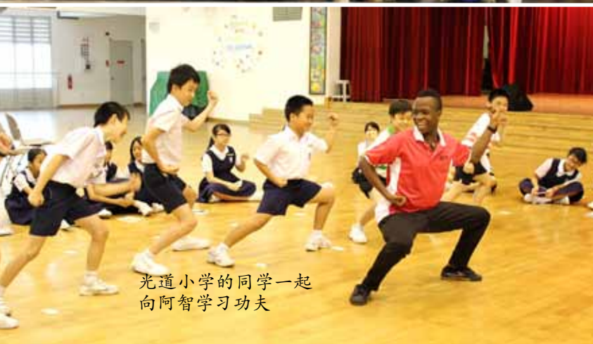
光道小学的同学一起向阿智学习功夫