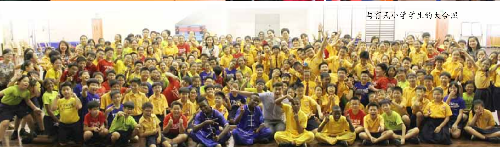
与育民小学学生的大合照