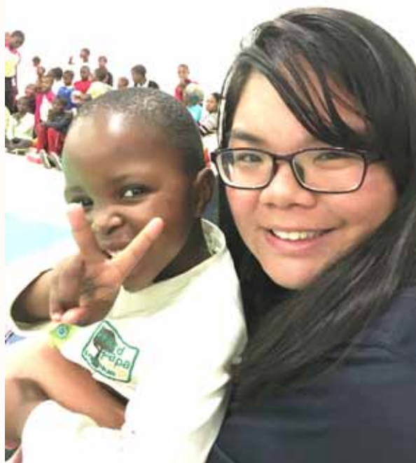
ACC可爱的小朋友们都很有镜头感

巴士转进了村落，在满地石头的道路上前行着，红色的屋顶映入眼帘。终于到了赖索托ACC！一下车，只见阿满妈妈叫几个小男孩来帮我们很重的行李拿到房间。在不远处，也有一些孩子在玩耍，有些热情地向我们挥挥手，有些则害羞地躲在墙后。好可爱的孩子啊！