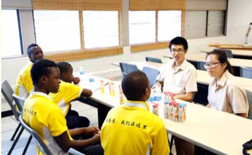
四位非洲少年与南洋初院的同学分享他们的梦想

上周，学校安排由保姆陪同我们回到各自的部落探亲。一回到家弟弟妹妹们便拥上前欢迎我，他们的笑容比五年前更灿烂，身子也比五年前更好。从老家门口望去，还是一片光秃秃的黄土地。不远处那棵高矗的