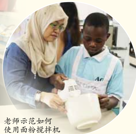
老师示范如何使用面粉搅拌机

生命到底是苦难还是磨练？在参加过与四位非洲孩子的交流会后，这个问题一直在我脑海中萦绕，久久挥之不去。