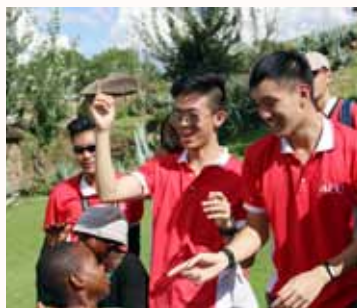
Sing-along session during our visit to CBO.