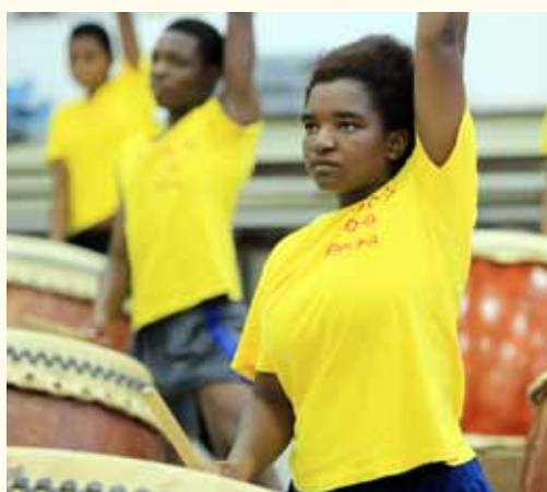
万穆参加优生神鼓

你们能想象上课时妳什么都听不懂，看课本也不知道老师在讲哪里吗？同时，你的同学写了很多的笔记，你什么都没写，这时候你会有什么样的感觉？