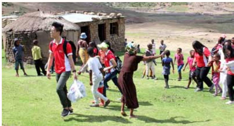
部落里热情的老奶奶，以其独特的嗓音迎接我们的到来

让我印象最深刻的是部落里的一个老奶奶。她非常亲切、友善。我们刚踏入部落时，她就开始跳舞，脸上的笑容无比的灿烂，非常活泼。当我们要离开时，她紧紧的抱着我，牵着我的手，陪我走到巴士旁。她眼眶泛着泪光，但还是露出了那灿烂、童真的笑容。她偷偷的擦掉了快流下的眼泪。她不断的停下来，给我一个拥抱。拥抱，是世间最好的礼物。拥抱可以让双方达到心灵和精神上的共识。老奶奶给我的拥抱，让我感受到她心中的忧伤和感恩。