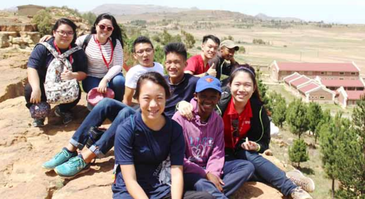
Taking a group photo at the mountain top located behind ACC.