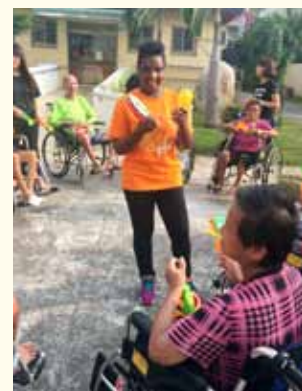
万穆到老人院服务，为老人家表演节目，逗他们开心

大家好！我是万穆。四年过去了，不知道你们还记不记得我们？我们只能用回忆来想念大家。