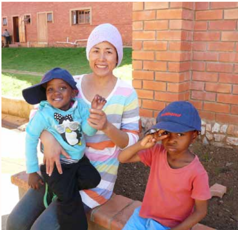
与史瓦济兰ACC的孩子相处融洽

因为激动，每天都兴奋着，根本没有时差的感觉。因为特别爱孩子，每当看到孩子们更是兴奋，只想多陪陪他们，只想给他们更多的关爱，忘记了疲倦。很长一段时间，从早上五点多到院区到晚上八点多送孩子们回孤儿房才回宿舍，每天过得很充实、很开心。甚至是周末，除去吃饭时间，我都会在院童房外陪孩子们玩。惊奇地发现这