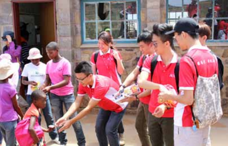
新加坡学生把带来的饼干、蛋糕分给部落的孩子

我们按照原计划给部落的人民分发食物和文具。非洲的孩子们排成一条长队——领取这些东西，然后心满意足地离开，好像是得到了什么稀世珍宝。有些孩子直接咬起了还未拆开包装纸的饼干。更有人把橡皮擦丢进嘴里，津津有味地咀嚼，吓得我一身冷汗地连忙示意她吐出来。