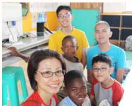
Let's take a picture together.