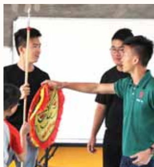
Story-telling for the children.