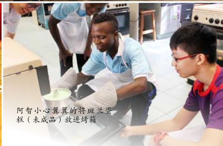
阿智小心翼翼的将斑兰蛋糕（未成品）放进烤箱