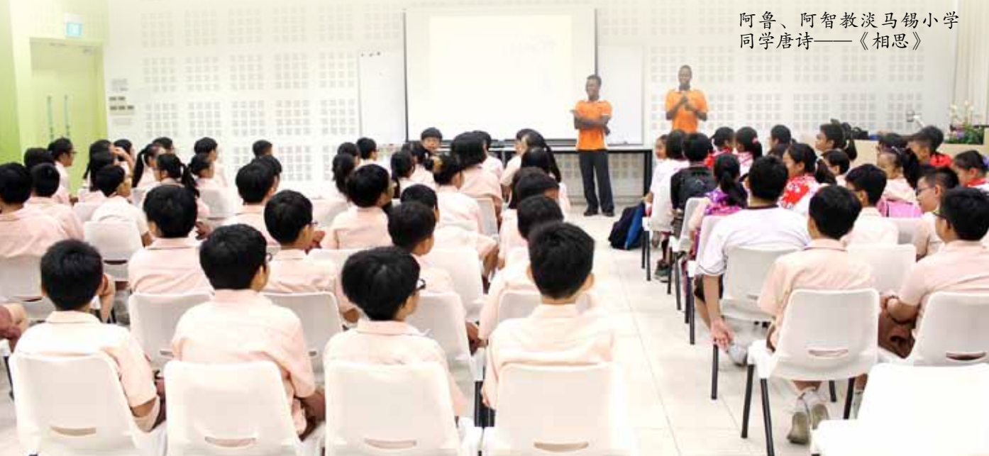
阿鲁、阿智教淡马锡小学 同学唐诗——《相思》

我想，我会永远记得那一天的交流会。马拉威少年们在恶劣的生活环境下没有放弃，他们仍然愿意努力地学习，坚持不懈地奋斗，为自己创造更美好的生活。他们的精神让我深深地受到感动。他们快快乐乐地学华文，点亮了自己心里的那盏灯。少年们，加油！