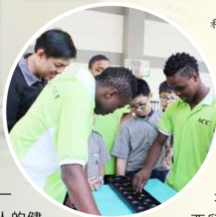
种族和谐日—— 阿鲁尝试新加坡的传统游戏

新加坡对于“老人福利”也做得很好，让我们都很羡慕！我们之前在一所学校与新加坡同学一起上课时，了解到了新加坡的政府对于老一代的人非常照顾，像是照顾退休老人的健康保健、休闲活动还有公共车资优惠等等。此外，有一些老人院也会给住在老人院的老人特别的津贴。在新加坡还有很多老人活动中心，可以让他们认识新朋友和学习新事物。因为在非洲也有很多的老人是需要被照顾的，但是他们就是都无法得到完善的照顾！