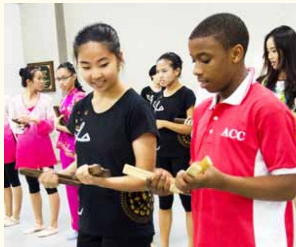
泓屹细心教导清孝怎么打竹板

他们从小丧失父母，我原以为他们的目光里至少会有一丁点的呆滞消沉。我惊奇地发现他们黑亮的眼睛只散发着不可思议的