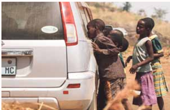
车外的孩子望着车内的人吃饭