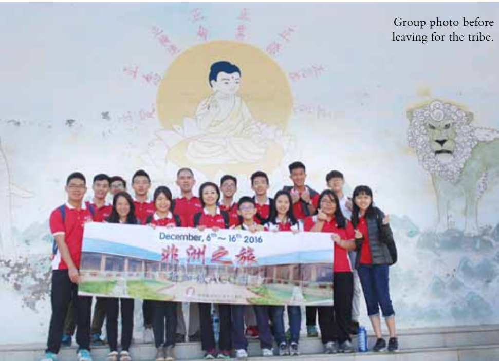
Group photo before leaving for the tribe.

I felt the real extent of this harsh environment one afternoon while walking from the main hall to the school compound to help out at the library. The walk took only 5 mins but by the time I reached the library, I was temporarily blinded by the afternoon sun and had to “acclimatize” before I could begin to do anything. During that time, no one could be seen out in the open. Lips could crack and bleed and the skin, especially the hands, could be cut out of nowhere.