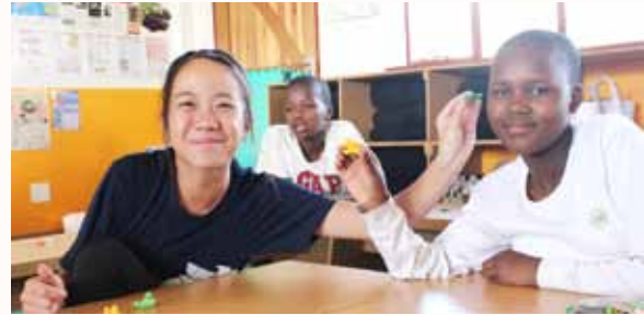
Origami making with the kids.

I will not say that I have become a completely different person after witnessing all that poverty but I can say for sure that I have developed a new courageous passion and appreciation for the horizon ahead.