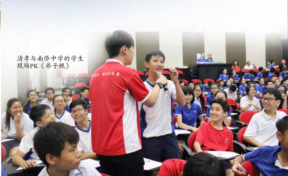
清孝与南侨中学的学生 现场PK《弟子规》