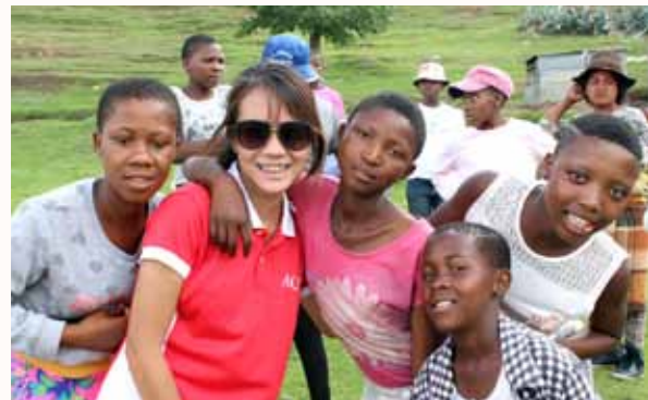
Children at the tribe love photo-taking with our students.