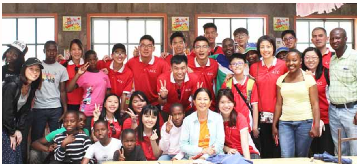
完成部落教室的布置后，灰沉沉的墙壁瞬间添上了一丝彩色