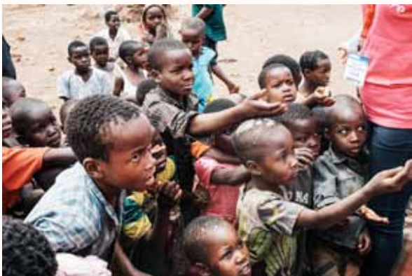
孩童看到糖果，纷纷上前伸手讨

除了物资，团友们也携带了许多糖果饼干，准备分发给村落的孩子。当孩子们知道有甜点吃时，都一窝蜂冲上前挤在分发人面前，把那骨瘦如柴的小手伸上前，希望自己可被分到一两颗糖果。