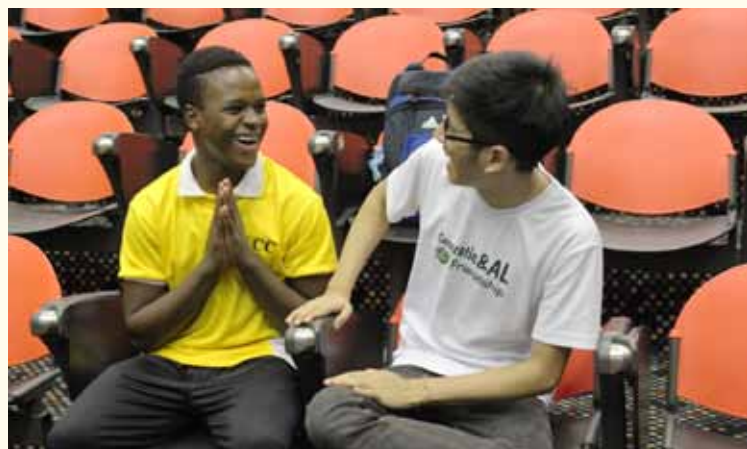
阿鲁与义安佛学会的同学相谈甚欢