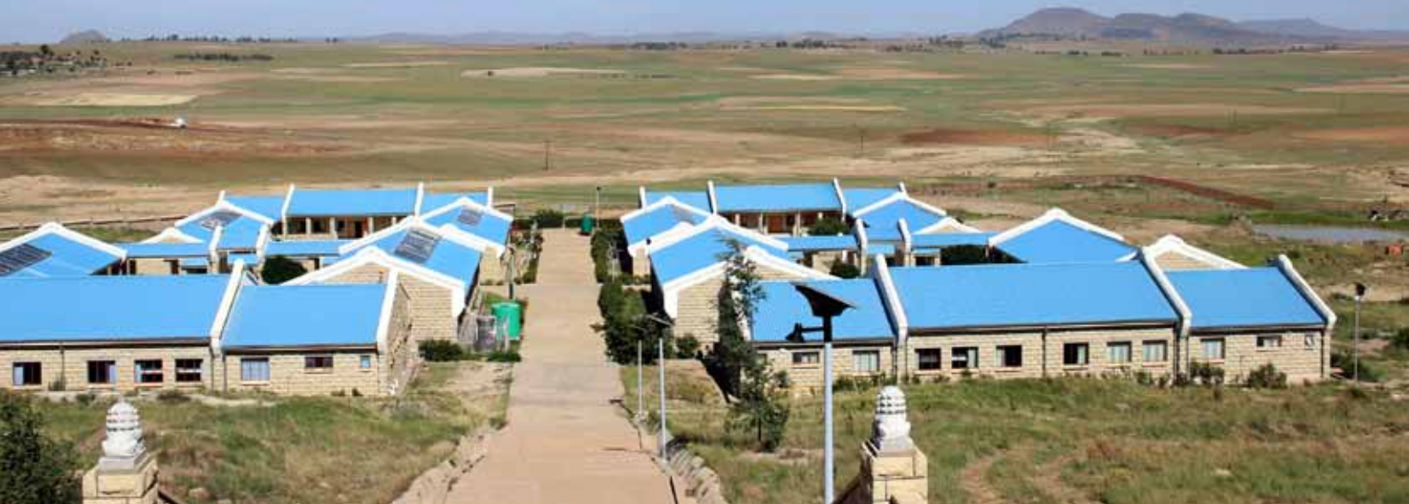
赖索托ACC孤儿房——慈、悲、喜、捨

12月5号，结束了一个繁忙的学期，终于迎来了赖索托之旅。自从接到了新加坡阿弥陀佛关怀中心的电话，心情就一直无法平复。毕竟是第一次踏上神秘的非洲大陆。我对非洲的认识都仅仅停留在书籍资料和电影上，这一次的亲身体验给了我巨大的震撼和感动。