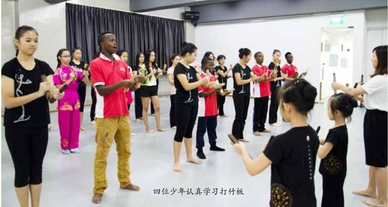
四位少年认真学习打竹板

意志与快乐。看着他们，我不禁反问自己，眼睛上一次散发出这种光芒的时候究竟是何时？久违了，那还是小时候吧。不知道什么时候我已经不再是志在四方的我，我习惯了生活中千篇一律的苦差事；我习惯了敷衍、应试；我习惯了做我不喜欢的事。小时候的梦想——“我要拯救世界！”也只是天真、不切实际的美梦。我渐渐接受了我生来或许就是微不足道地活着，任由命运宰割，泯然众人矣。