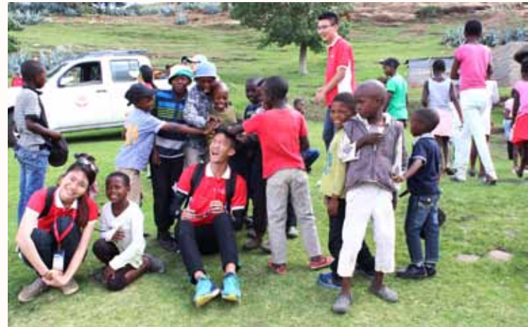
Children in the village love to play with our hair.