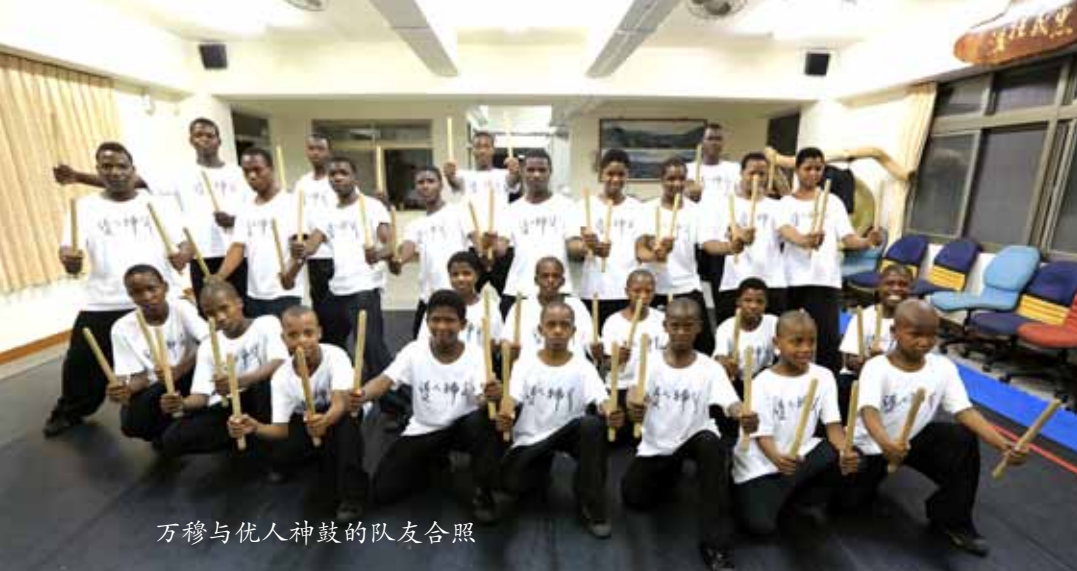
万穆与优生神鼓的队友合照