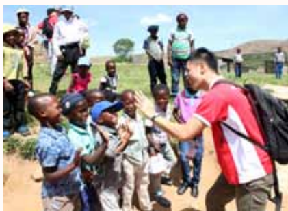
Hi-5! These kids are just too adorable.

Overall, the Africa Learning Journey has reminded me of the important lessons which I have forgotten over the years as I grow up. I would definitely take the opportunity to visit them again.