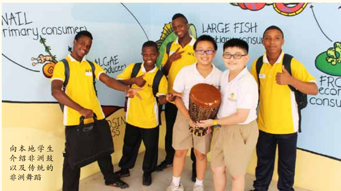
向本地学生 介绍非洲鼓 以及传统的 非洲舞蹈

我们跳舞的时候会穿着动物头饰。头饰也是用动物的皮制成的。在马拉威不论 在什么时候都可以跳舞。马拉威人很有舞蹈的天份。有时候在月亮高挂的晚上，不 管男女老少，我们都会尽情地跳舞，心情非常畅快。