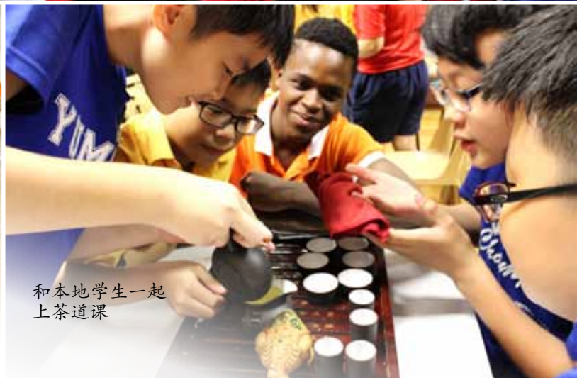
和本地学生一起 上茶道课