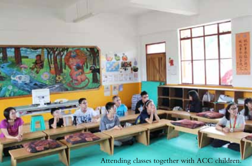
Attending classes together with ACC children.

We can see miles and miles of blue sky and white clouds in Lesotho. Against this amazing backdrop, the boys played 40-over-players soccer. They were busy chasing the balls. I stood, captivated by the sight.