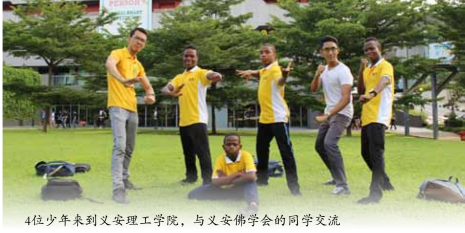
4位少年来到义安理工学院，与义安佛学会的同学交流