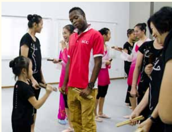
阿智津津有味地看着小妹妹打竹板

震耳的嘶吼一个个强而有力地回响在舞蹈室。他们翻着筋斗，紧握的拳头猛一击掌——“啪！”就在那时，我见证了什么是生命力。它穿透舞蹈室的灰色墙壁、穿透四周围绕的楼房、穿入我的心灵。他们好像沙漠的猎豹，而我似乎就在那沙漠里。只是短短的几分钟，却是我所见过最刺激、最令人热血沸腾的武术表演。他们并不在表演炫技。他们演绎着他们面对艰苦的未来昂首挺胸地怒吼走去。