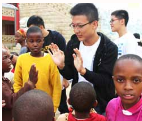
兆成与ACC的孩子们一一击掌道别

白驹过隙，日月如梭，一周的时间转瞬即逝，还来不及回味，便要坐上离开的巴士。幸亏是在早上离开，院童们都在圆通学校上课，否则面对那么多舍不得的眼神，离别将变得更加悲伤。离开的一路，望着窗外的风景，我并没有觉得十分的难过。因为这一周让我发现关怀中心的孩子们有着良好的生活环境并接受着高水准的教育，他们和我们新加坡的学生们一样，我也相信自己在大学一定会再次遇到他们。正如和他们约定的那样，我也一定会再次回到赖索托，回到这与世无争的桃花源，与大家再次相聚。