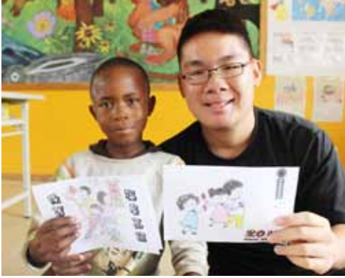
Making CNY cards.