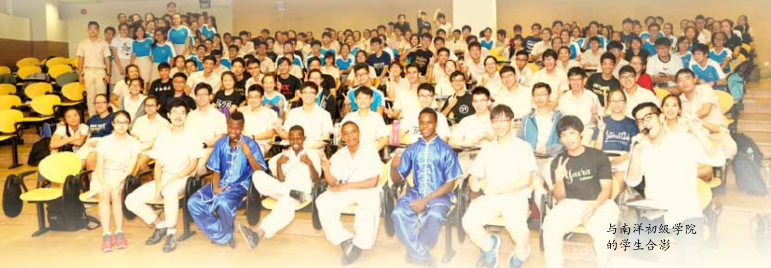
与南洋初级学院的学生合影

从我老家门口望去，是一片光秃秃的黄土地。不远处有棵高矗的树，只剩下灰白的树干，上面长出若干枝丫，也是光秃秃的，叶子都掉光了。年幼的我看来，这棵树好像一位生命快到尽头的长老伸出手指，乞求老天让他活下去。偶尔，枯树前会出现几只野生动物——老虎、狮子、豹——有时它们活奔乱跳，张牙舞爪，有时它们奄奄一息，血肉模糊，躺在黄土地上，任它们的天敌，或者我的爸爸妈妈，宰个一干二净。