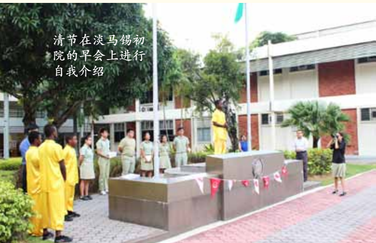
清明节在淡马锡初院的早会上进行自我介绍

没有一个生命是没有渴求的 每一个不安分的心脏跳动着 你鼓舞了我 所以我能站在群山顶端走过狂风暴雨 你鼓舞了我 让我能超越自我