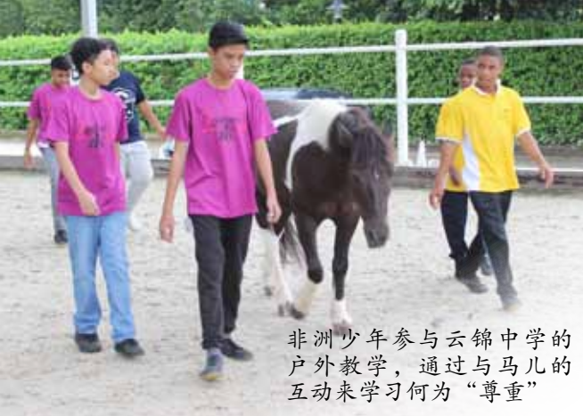
非洲少年参与云锦中学的户外教学，通过与马儿的互动来学习何为“尊重”