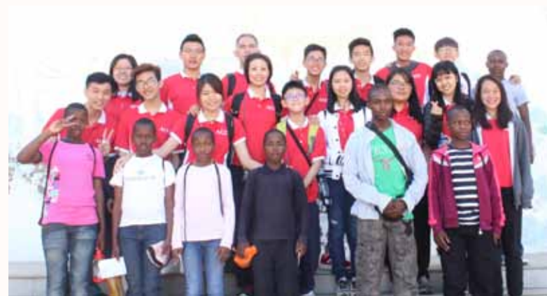
Group photo before leaving for the tribe.