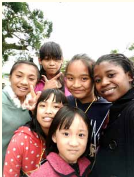
万恩到乡下，给原住民小朋友上课