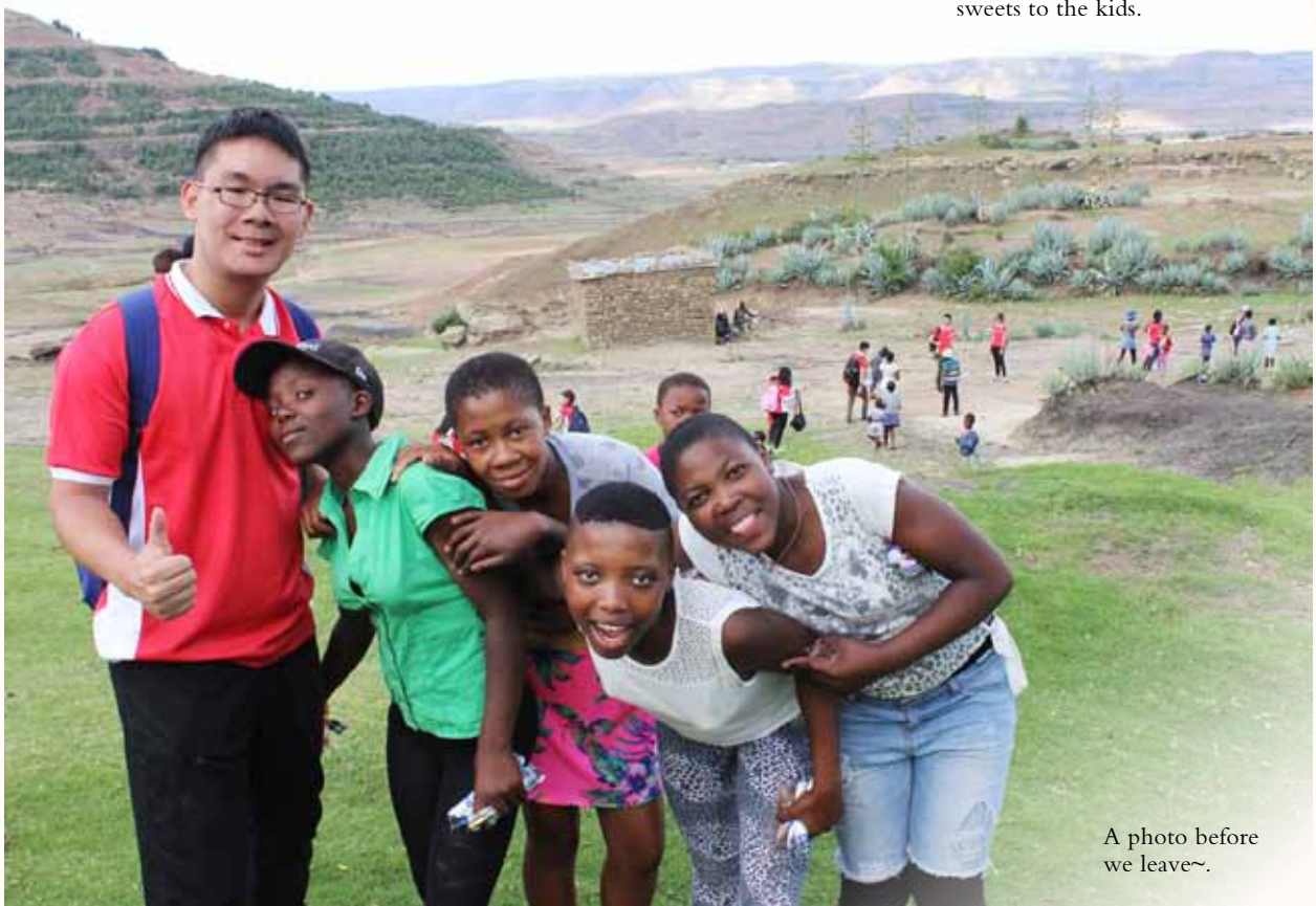
A photo before we leave~.