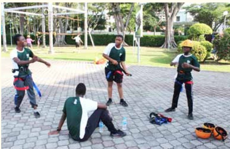
能够与淡马锡初院的同学一起参与攀岩等户外活动，少年们都十分兴奋