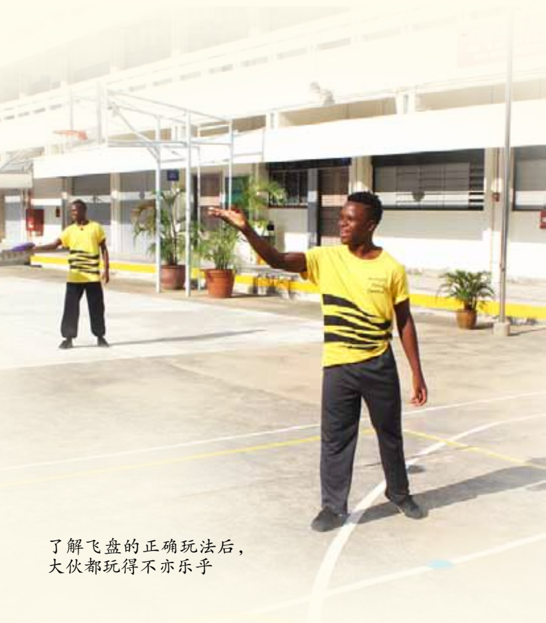
了解飞盘的正确玩法后， 大伙都玩得不亦乐乎