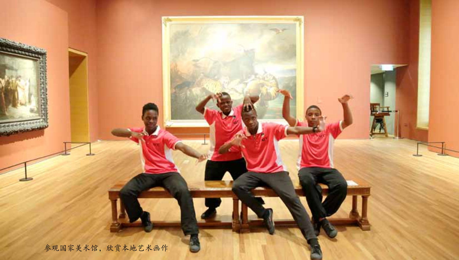
参观国家美术馆，欣赏本地艺术画作

新加坡的“包容精神”让我们更喜欢这次的旅程。新加坡没有种族和宗教歧视的问题。新加坡人看到客人或是接待客人都不会有排斥的动作，他们都会开心地接待客人、主动地和他人说话或是聊天。在他们的眼裡，应该没有去分你是白人、黑人、华人还是印度人等等……。这种做法和行为是我们大家都应该去学习学习的。新加坡这个国家有四种民族，但他们却能够有这样的模范，我们大家为何不行？我们也可以做的到吧？！