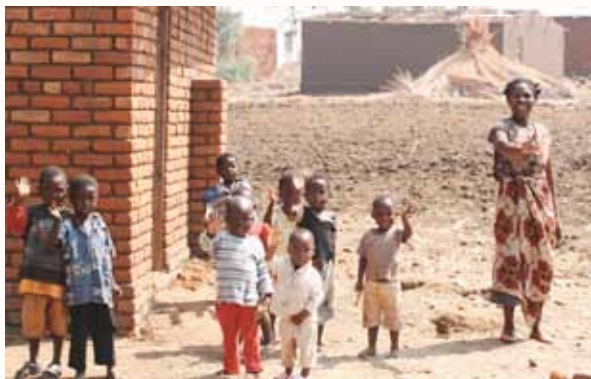
马拉威大人孩童向在车上路过的我们招手