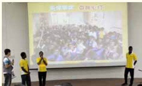
清孝与淡马锡初级学院的大哥哥、姐姐们分享了他们在部落上课的情形