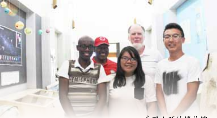
参观山顶的博物馆