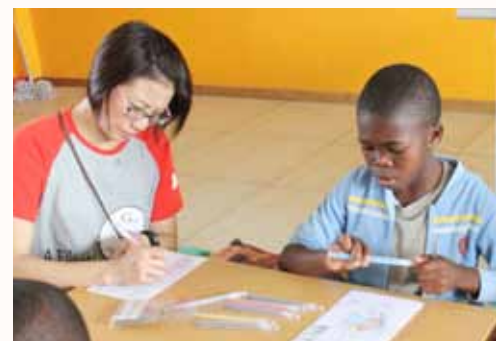
CNY card making.