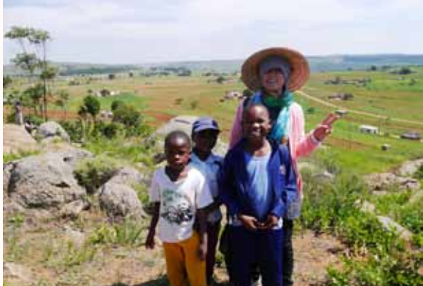
少莉师姐与孩子们

屈指算来，来史瓦济兰ACC已五个月有余。这期间最令我感动的是孩子们的功夫表演。看着台上孩子们一板一眼的认真表演，感受着台下孩子们的互动和欢呼声，每次都被感动。感动之余，脑海里总会浮现“台上一分钟，台下十年功”这句话。