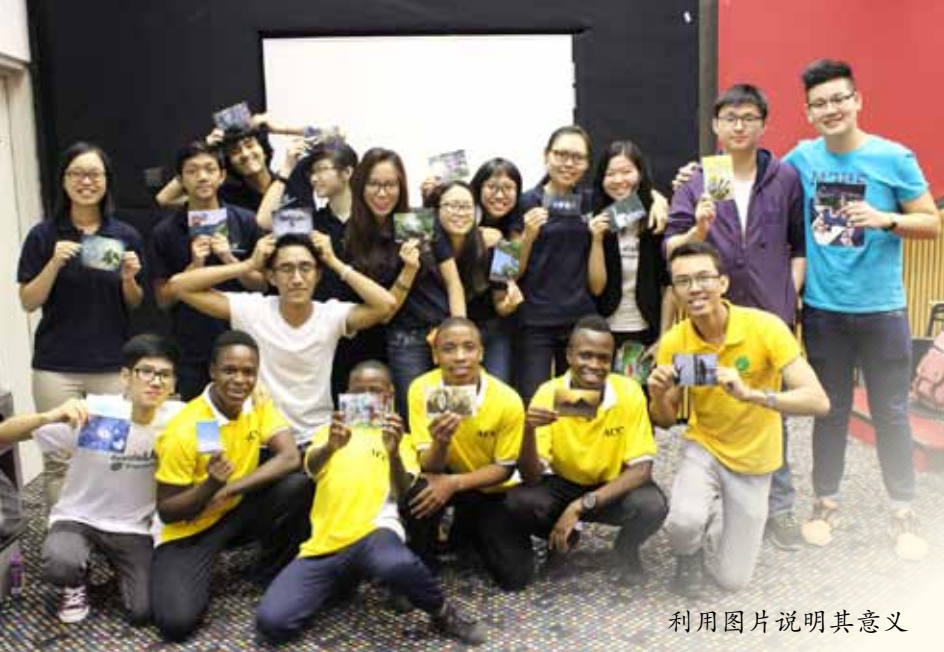
利用图片说明其意义