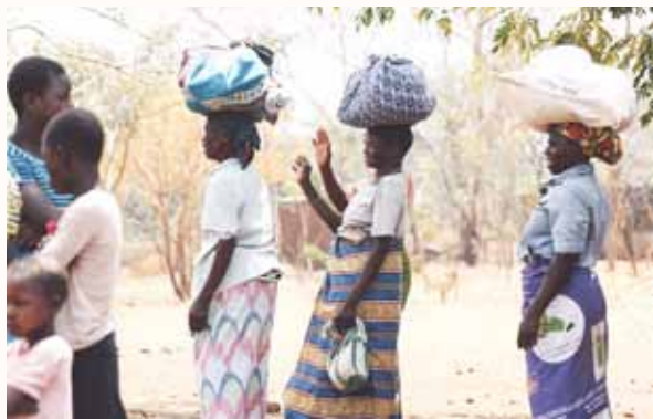
马拉威女子在领完物资后顶在头上走回家

前来领取物资的多数是女子。她们到物资站领取物资后，就把身上的纱笼摇身一变把物资包起，然后把这十几二十公斤重的东西顶在头上，稳如泰山地步行数公里回家。