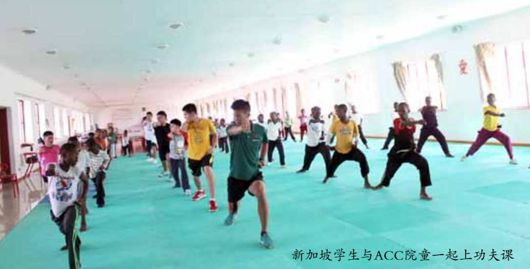
新加坡学生与ACC院童一起上功夫课