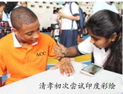
清孝初次尝试印度彩绘