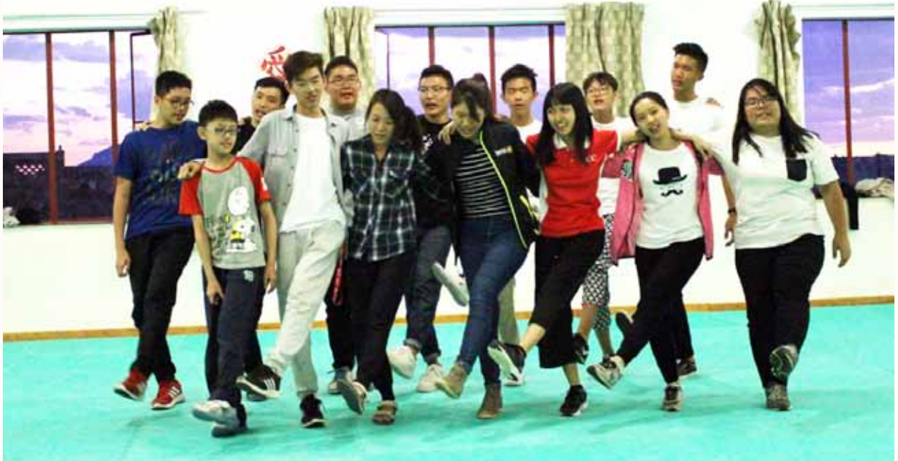
Finale~Singapore students putting up their performance for Lesotho ACC.

Albert Tjandra | 21 | NTU School of Business