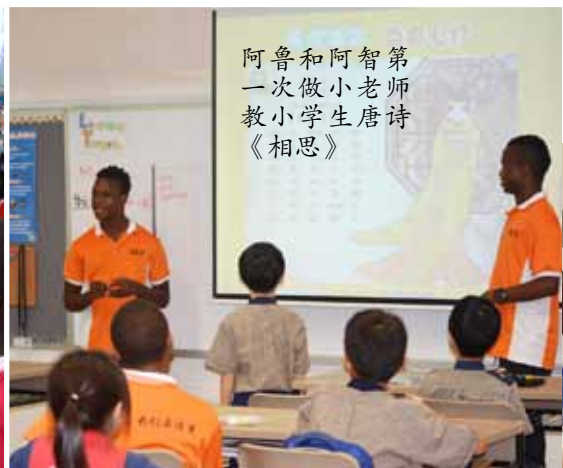
阿鲁和阿智第一次做小老师教小学生唐诗《相思》