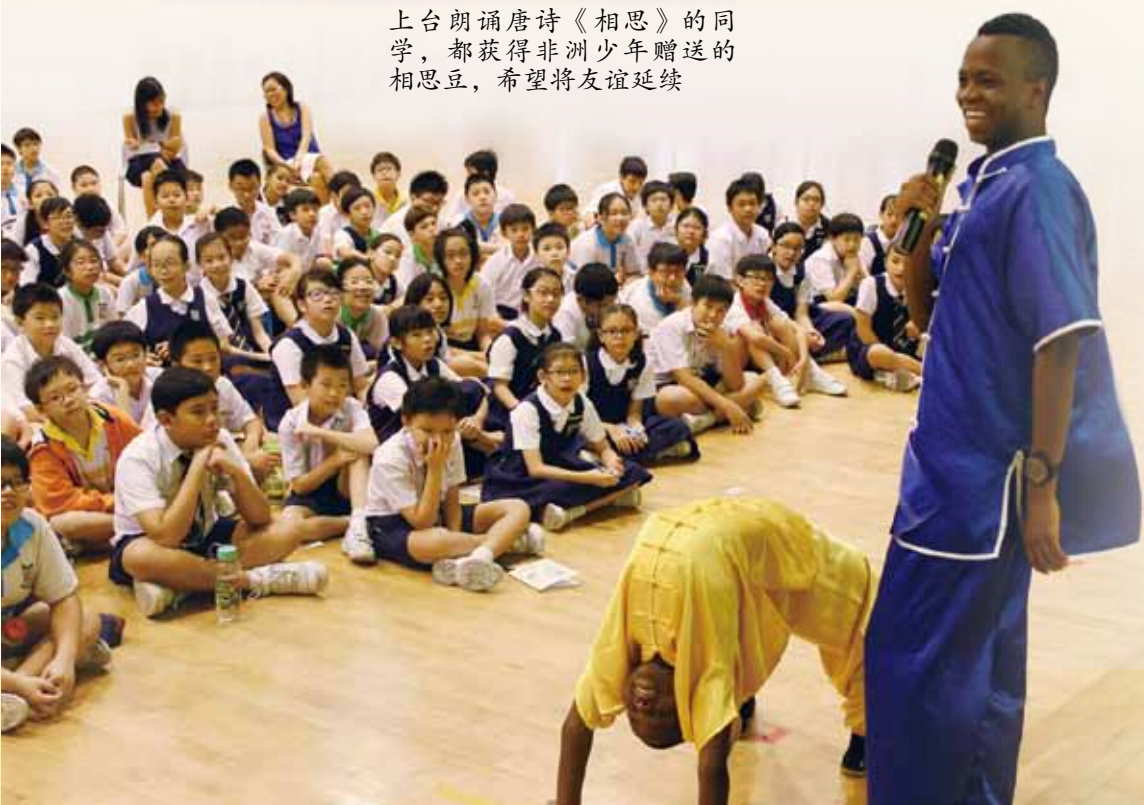
阿智与清节和光道小学的同学分享了每天早上的晨运都会练习下腰等动作

在活动的最后，我幸运地获得了他们赠送的一瓶相思豆。“愿君多采撷，此物最相思”，望着这一颗颗坚硬、光洁、火红的相思豆，我想我会永远记得他们——来自非洲马拉威的朋友们！记得他们的努力、他们的坚韧、他们对祖国深沉的爱！苦难压不倒他们，只有让他们更坚强。他们正像这一颗颗光洁的相思豆，在非洲的大地上闪闪发光。