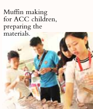
Muffin making for ACC children, preparing the materials.