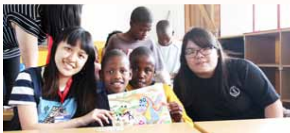
音如与ACC的孩子一起完成3D贴纸