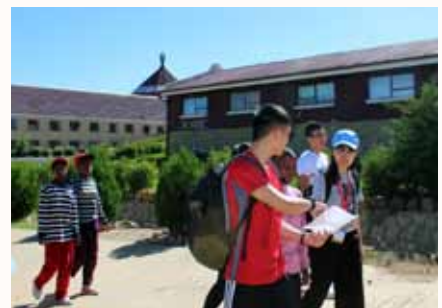
Touring of Lesotho ACC with little 'tour guides'.