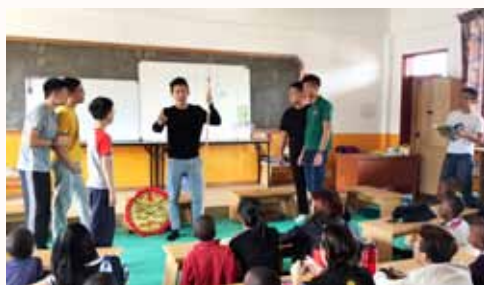
一边表演，一边说故事，大家都听得津津有味