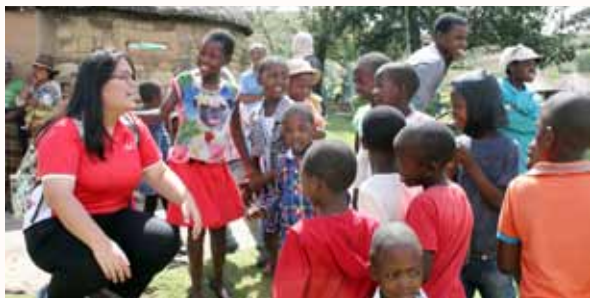
部落的孩子都对音如的长发感兴趣，不断地伸手触摸

其中一天，我们去了部落。原本以为只是去分发一些零食，帮忙他们搬一个月的食材和装饰一间课室。原来我们看似平凡的事情，却是他们埋藏在心里的万分感激。部落里的孩子都有一颗好奇心。当我们在布置课室，在做一些手工时，他们都围绕着桌子，争着要帮忙。他们会靠过来，想了解新加坡的事物，有些还跟我分享了他们的志愿。虽然自己的生活环境不是非常好，但不少孩子希望长大后能当老师，为下一代的孩子创造更好的未来。也许因为生活环境的关系，孩子们会争抢，争着得到你的注意、争着和你拍照、争着摸你的头发等等。但他们，仍然保有一颗纯质的心。