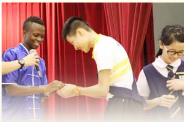
上台朗诵唐诗《相思》的同学，都获得非洲少年赠送的相思豆，希望将友谊延续

让人惊讶的还有他们的歌声，一首洪亮、深情的华文歌曲《小人物的心声》直击我们的心扉。“也许我一个人，不能成就一番大事业，但我尽力贡献一份微薄的力量。”是啊，如果大家都团结起来，这个世界就会变得更美好。但更让人赞不绝口的还在后头，四位非洲朋友竟然背诵起《弟子规》和多首唐诗，我们一个都不会