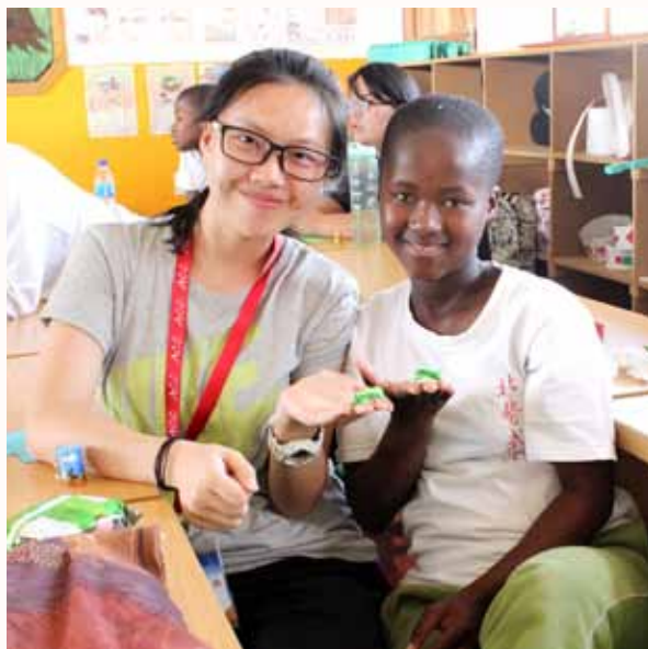
凯茵与地慈一起做的，会“翻滚”的纸青蛙

十年后的今天，我带着儿时的回忆，首次踏入非洲这块神秘的土地，企图验证那遥远的记忆。然而，我似乎忘记了，时代是在发展的，而我们也应该用发展的眼光看待事物。首先，现在的部落人民并非衣不遮体。至少我所看到的人们都穿着和我们差不多的衣物。再者，他们的生活虽然贫穷落后，但他们自得其乐。采集、放牧、上学、纺织、唱歌、跳舞……与世无争。看到这些，我有点失望，但更多的是庆幸和欣慰。