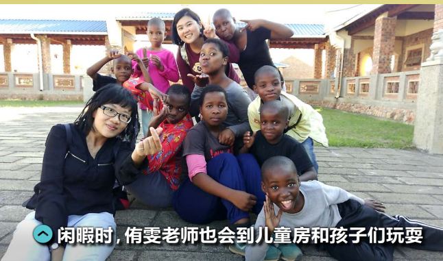
闲暇时，侑雯老师也会到儿童房和孩子们玩耍

在 ACC 工作除了中文教学还有许多行政工作必须协助，并且食、衣、住、行、育、乐都和台湾有太多太多的差异。教学时还得被小孩在课堂上时不时气一下，在史国的前三个月我都想提早卷铺盖回家。但当你走在谷底，处在低潮并且想一怒之下订回程机票时，总是会有小棉袄出现。“老师，你是不是不开心？跟我说，我去揍他。”，“老师，你不要不开心，给你一朵花。”一朵花、一张关心的小卡总会不期而来。