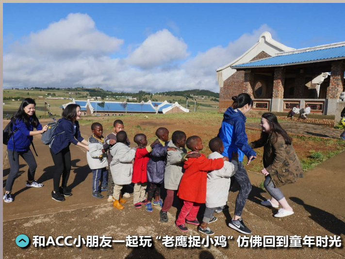
和ACC小朋友一起玩“老鹰捉小鸡”仿佛回到童年时光

回国后，我会常常想起他们。他们能不能顺利长大，未来会如何，其实这些都是未知数。如果以后有机会再去史瓦帝尼 ACC 院区，我非常希望能在院区多陪陪孩子们，希望那群可爱、纯净如水的孩子们也还能记得我。