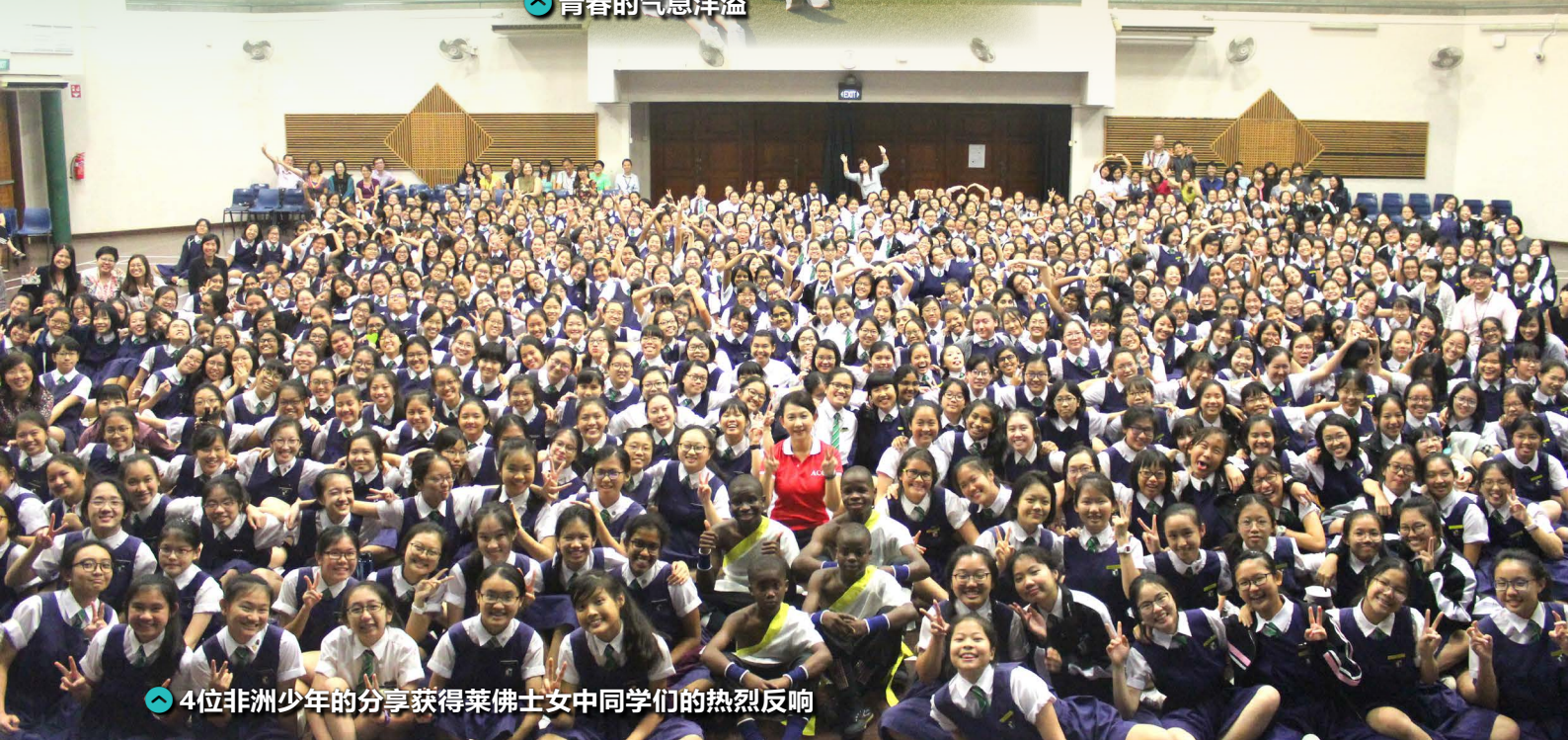
👉 4位非洲少年的分享获得莱佛士女中同学们的热烈反响