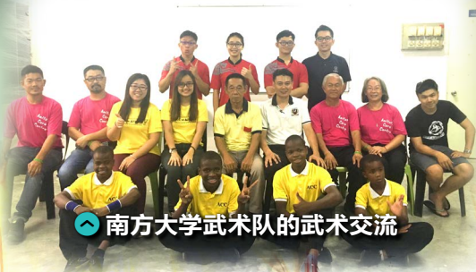
南方大学武术队的武术交流