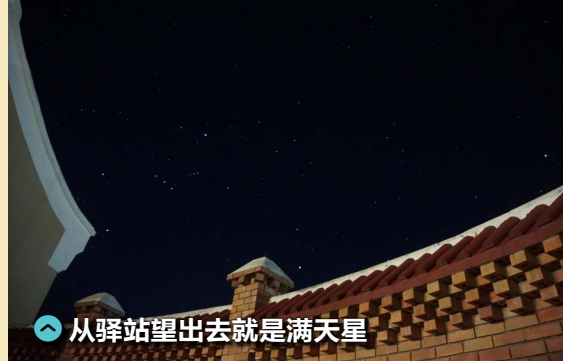
从驿站望出去就是满天星