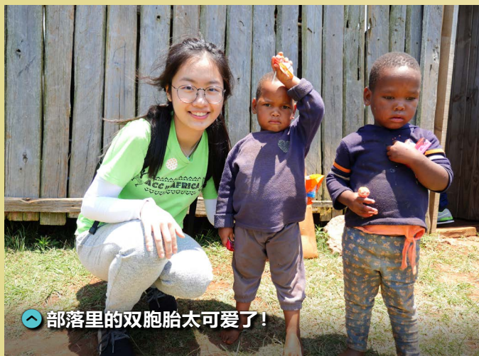
部落里的双胞胎太可爱了！