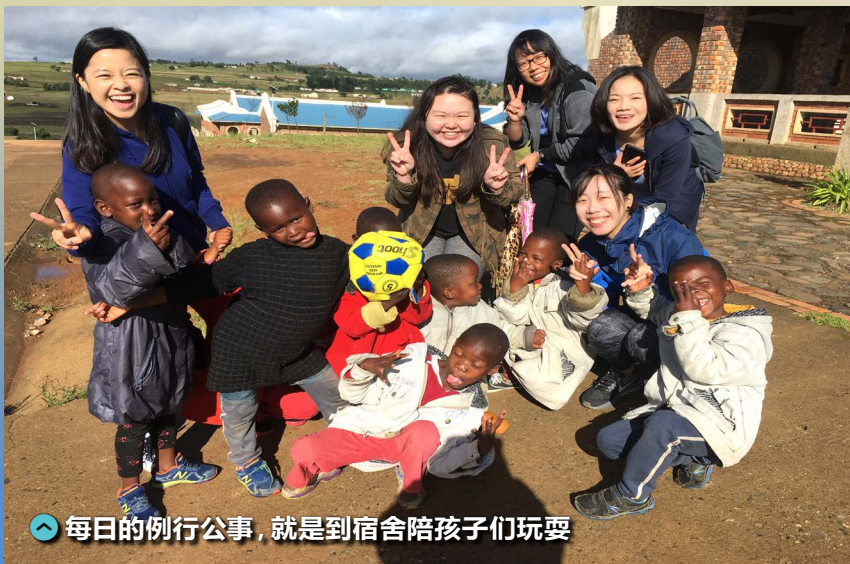
每日的例行公事，就是到宿舍陪孩子们玩耍