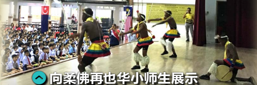
向柔佛再也华小师生展示史瓦帝尼传统舞蹈