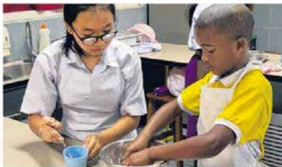
非洲学生和本地学生一起亲手制作咖喱角。

2018年，我踏入了淡初开始高中第一年生活。从学校的咖啡厅看出去，看到了那棵枝叶茂盛的芒果树，它的树荫伸向蓝天，大大的树荫底下有四排木头的桌子椅子，供学生们使用。上课上得精神疲乏时，到咖啡厅里买杯饮料，到树荫下坐下和朋友交谈。原来忙碌的生活也可以过得如此惬意。