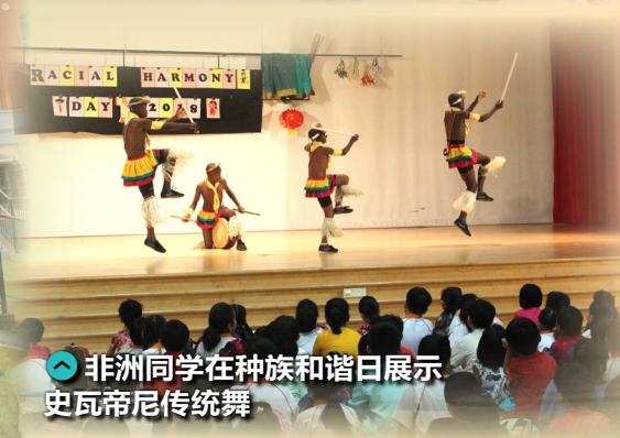
👉 非洲同学在种族和谐日展示史瓦帝尼传统舞