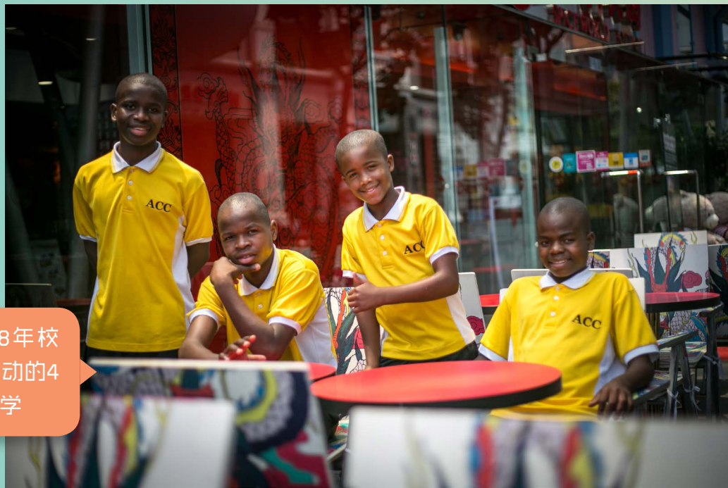
参与2018年校际交流活动的4位非洲同学

在遥远的非洲，有着一群因饥荒、因疾病而无家可归的孩童。于是，ACC 在非洲设立孤儿院和学校，为千名孩童筑起遮风挡雨的温暖家园，并透过教育传递他们能够改善未来的能力！《乐学华文 点亮心灯》校际交流活动缘起 2012 年，一群在非洲 ACC 圆通学校参访的新加坡义工亲眼见证 ACC 的孩子说中文、背唐诗，赞叹之余也萌生起与新加坡学生交流的想法。我们希望透过通晓华文华语的非洲院童，能够鼓励更多新加坡学生认真学习华文华语。除了帮助远在非洲的院童们，我们也致力于支持推广本地华文华语的教学与文化传承，为本地华文教育略尽绵力。 自 2013 年起，《乐学华文 点亮心灯》校际交流活动每年都会邀请 4 位来自 ACC 圆通学校的非洲少年与新加坡的同学们进行交流。非洲院童通过分享自己的故事与经历，表达他们对华文的热爱，对生活的珍惜及对梦想的渴望。连续 6 届的《乐学华文》活动共吸引了 164 所中小学府，甚至大学的参与，惠及超过 8 万名本地学生。校际交流结束后，我们也举办了《文字飞扬 触动心灵》华文作文比赛，鼓励新加坡学生将内心的感触记录下来。透过同学们的文章，不少学生被非洲少年们发愤图强、勇于逐梦的精神所感动。借此活动，我们希望更多本地学子们能够努力学好华文、珍惜当下、心存感恩。