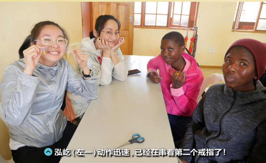
泓屹（左一）动作迅速，已经在串着第二个戒指了！

*注明：文中提到我受伤了。这是因为我在上功夫课赛跑时，不小心撞到了下巴。非常感谢医务室护士还有团员们无微不至的照顾，让我很快就恢复了！