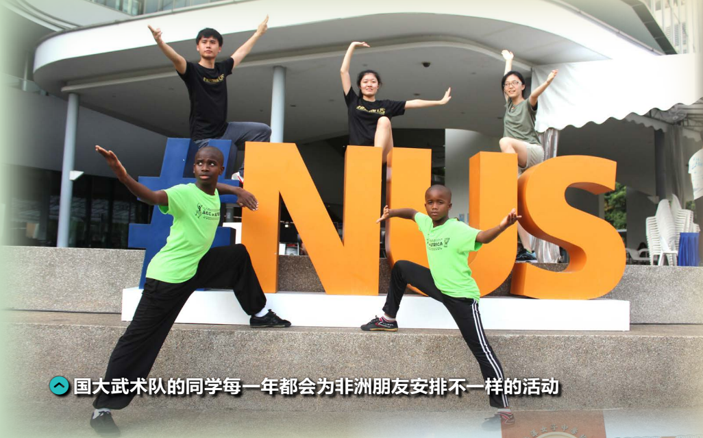
👉 国大武术队的同学每一年都会为非洲朋友安排不一样的活动