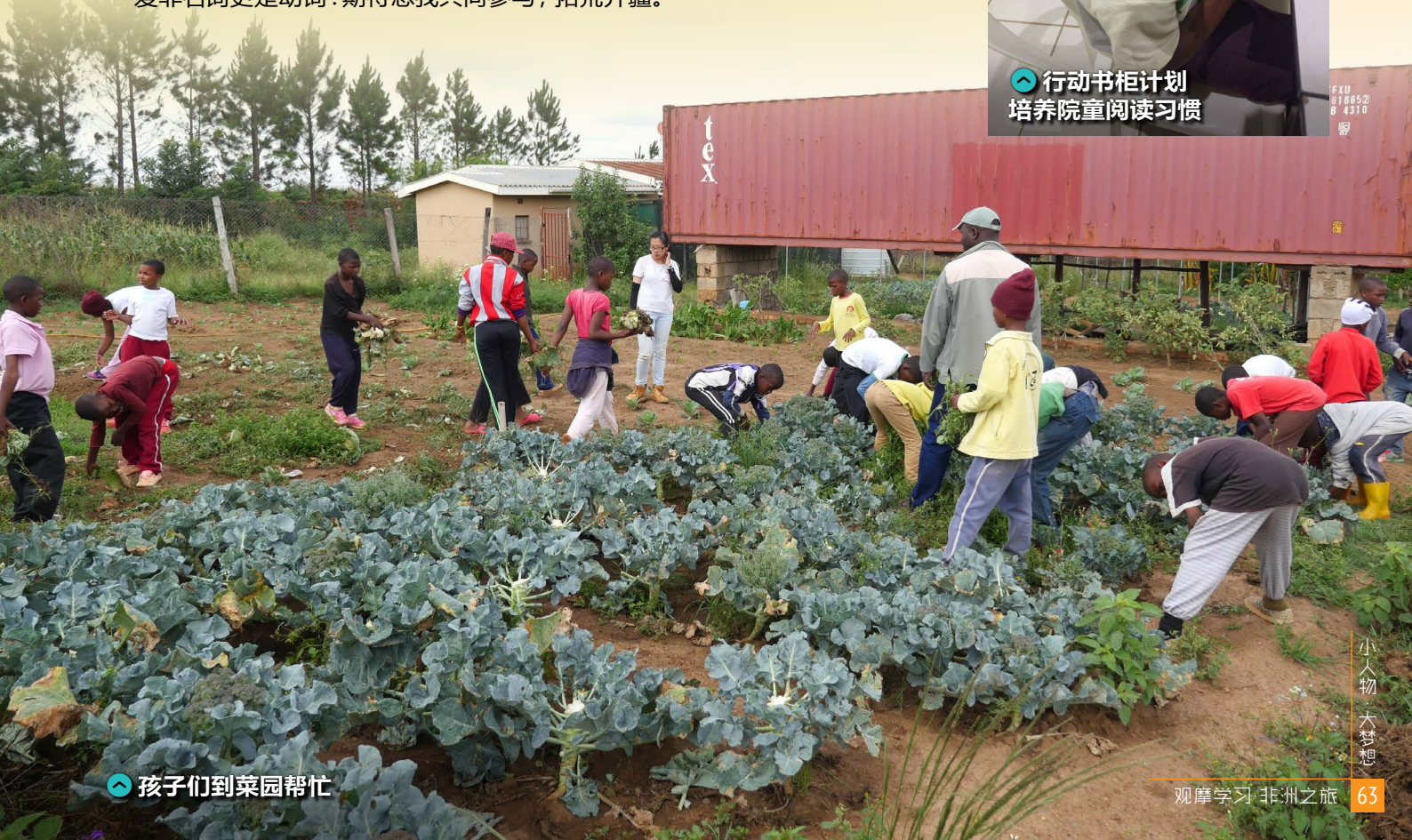
孩子们到菜园帮忙