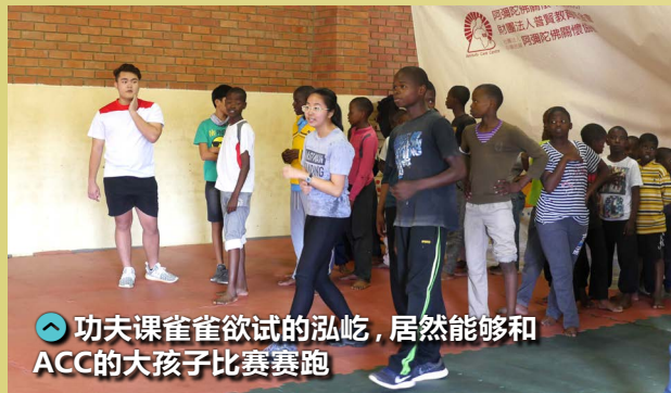
功夫课雀雀欲试的泓屹，居然能够 and ACC 的大孩子比赛赛跑

看到我受伤了，净玄总爱好奇地问我：“你的父母会担心吗？他们会怎么做？”当我买了一袋纪念品，净玄问我是买给谁。我说是我的朋友。她没听清楚，问我说：“你的父母？”我不吭声地点了点头，她便赞许地咧嘴笑了。对她来说，想象有父母疼爱是多么幸福，能够孝顺父母是多么奢侈。