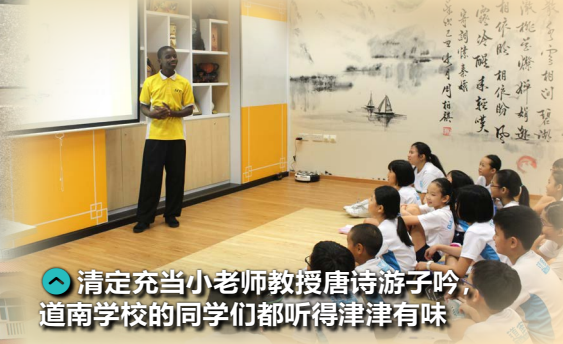
👉 清定充当小老师教授唐诗游子吟，道南学校的同学们都听得津津有味