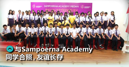
与Sampoerna Academy 同学合照，友谊长存