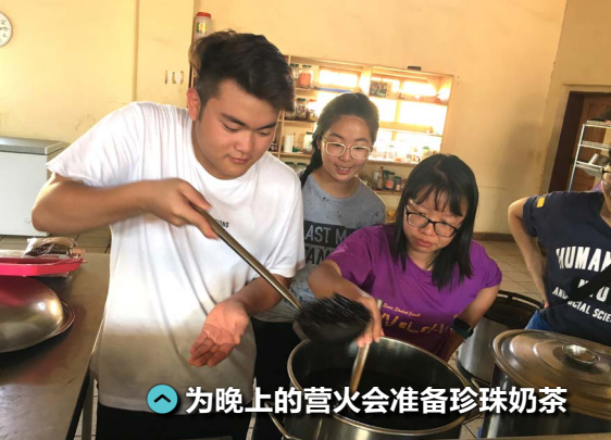
为晚上的营火会准备珍珠奶茶