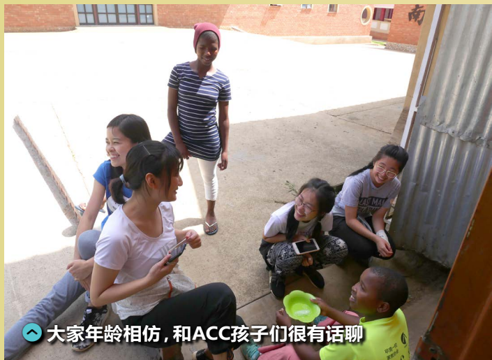
大家年龄相仿，和 ACC 孩子们很有话聊