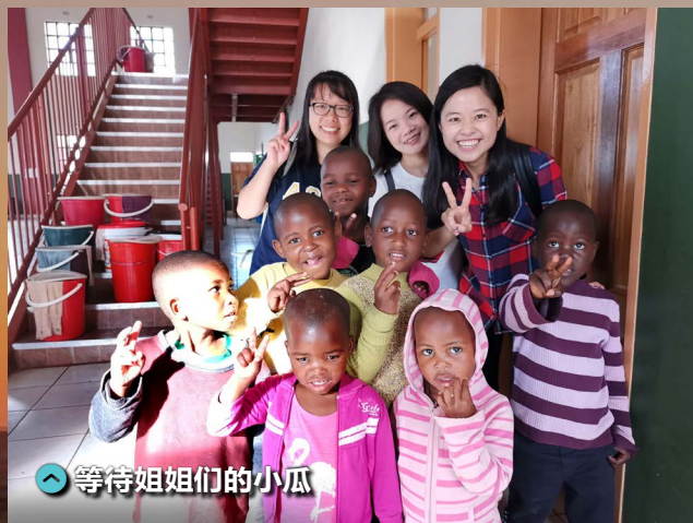
等待姐姐们的小瓜

“老师”、“姐姐”……一路上，年龄较小的孩子们话并不多，他们喜欢默默地牵着我们的手，陪着我们一路慢慢走向驿站，时而会仰头看着我们笑笑。年龄稍大一点的孩子则陪着我们一边走，一边聊着他们的家庭、生活、梦想等等。我们也非常享受这一段路程，一路与孩子们聊天、玩耍、自拍等等。