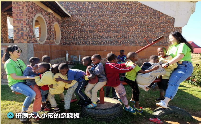
挤满大人小孩的跷跷板