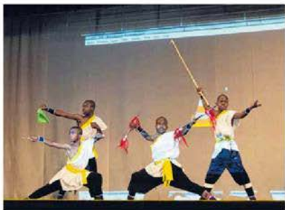
非洲学生展示武艺，技惊四座。

7月12日，女皇道中学邀请四名斯威士兰的学生来做客。四名男生用流利及标准的华语自我介绍后，并以非洲本土舞蹈开场，惊艳四座。