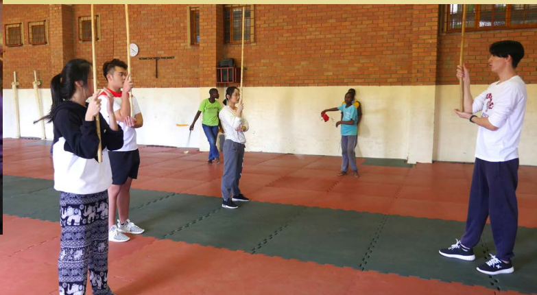
教练亲自指导怎么耍“棍”