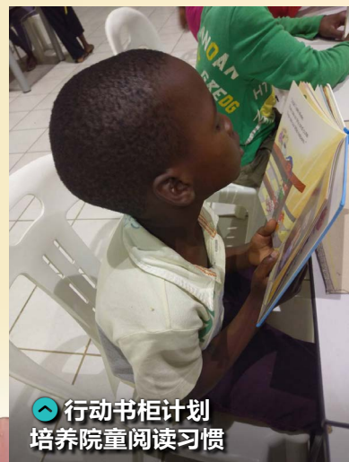
行动书柜计划 培养院童阅读习惯