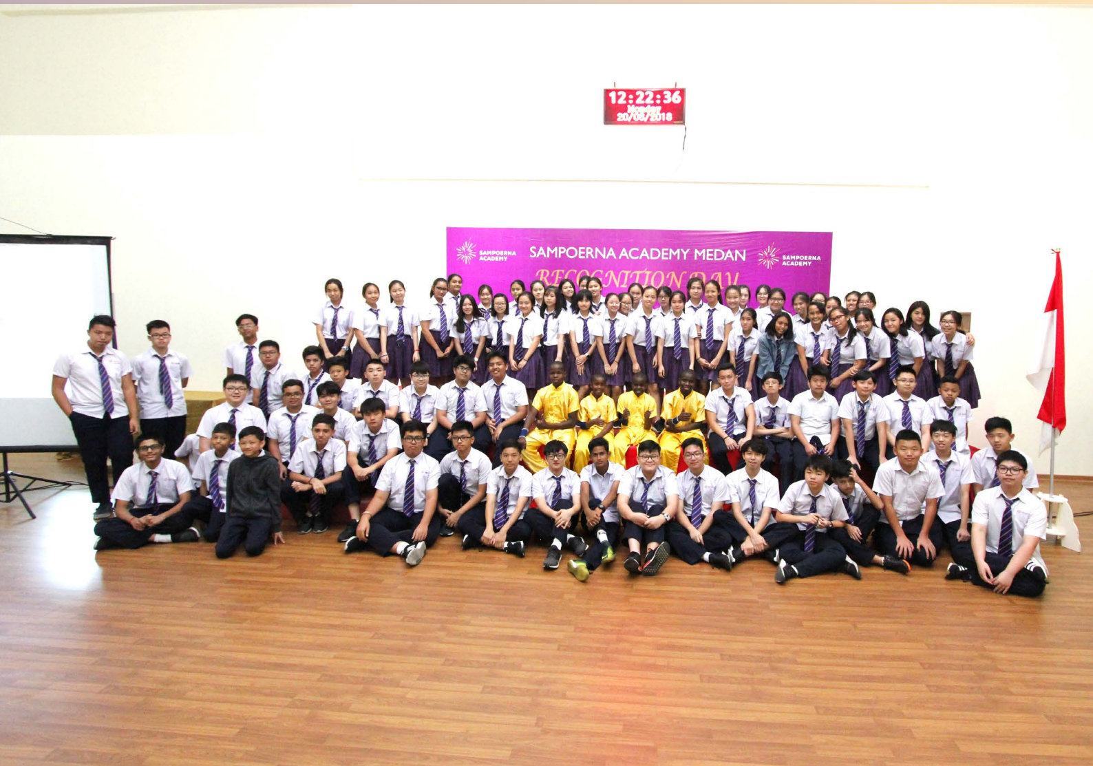
棉兰天宝学校的 同学合影留念。