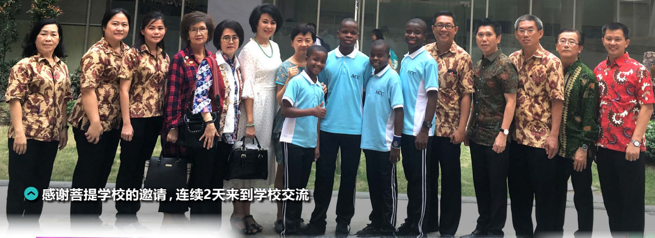
感谢菩提学校的邀请，连续2天来到学校交流