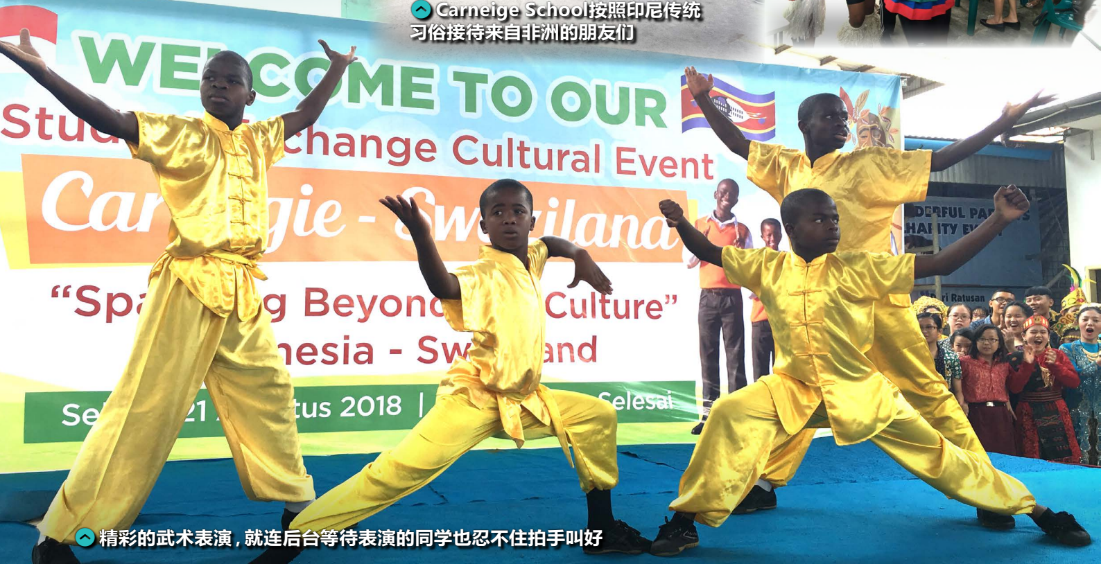
精彩的武术表演，就连后台等待表演的同学也忍不住拍手叫好