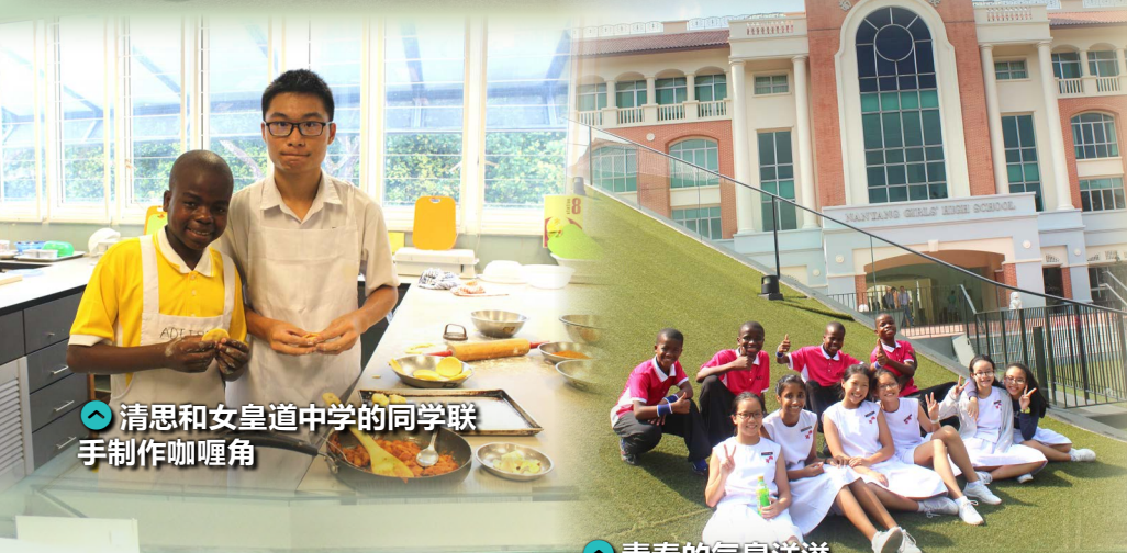
👉 清思和女皇道中学的同学联手制作咖喱角