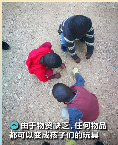
由于物资缺乏，任何物品都可以变成孩子们的玩具

有首歌这么唱道：“珍惜一切就算没有拥有”。一个用数个塑胶袋制作的足球、一个简朴的跷跷板，甚至用吸管做成的“指挥棒”，就足够让大孩子和小瓜们玩一整天……院区里的生活和设备虽说简单，纪律严格，孩子在物质上所拥有的不及城市里的孩子们，但精神层面上已经远超他们。也许是他们的生活或一些经历让他们比一般孩子成熟一些，但和孩子们相处的短短几天里，我深深地体会到了知足的精神、简单的真谛。