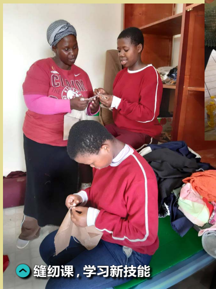
缝纫课，学习新技能