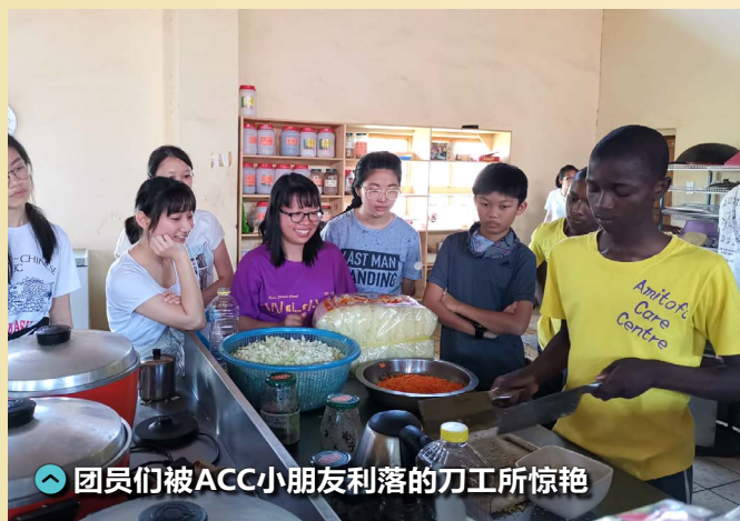
团员们被ACC小朋友利落的刀工所惊艳