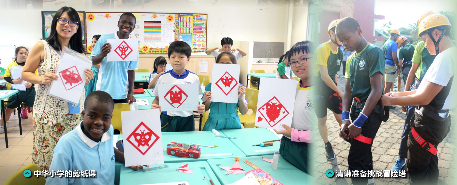
中华小学的剪纸课