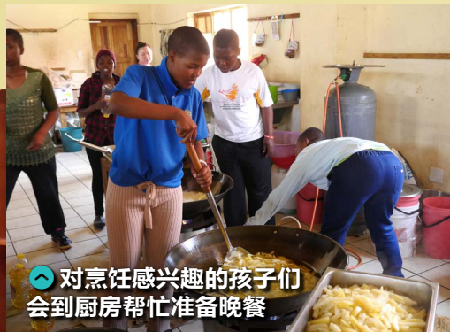
对烹饪感兴趣的孩子们会到厨房帮忙准备晚餐