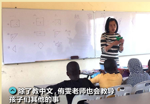
除了教中文，侑雯老师也会教导孩子们其他的事

在 ACC 总是有做不完的工作，许多时候得校长兼当敲钟的，完全就是一份钱少事多离家远的工作。但我想来到 ACC 的职义工，不论是因为有什么样的原因来到这里，共同的原因都是想为这里的孩子做些什么。