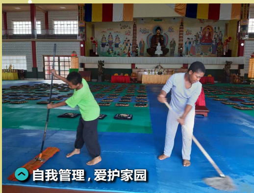
自我管理，爱护家园

说到这些院童们如何进入 ACC 真的就得从原生家庭切入。他们一生下来就面临着无数的考验。每次家访走进他们的世界，眼前无法遮风避雨的小茅屋就是他们最温暖的家，这并不是安贫乐道，而是别无选择。他们的童年不是在完整的家庭环境与良好的学校教室里度过，或许有些幸运的孩子能在母亲的呵护下长大，享受短暂快乐的童年，但是却有更多的孩子是一个人孤苦无依的成长，连个遮风避雨的家都没有。炊烟袅袅，看着小小的一锅玉米糊却要温饱整个家庭，而僧多粥少，挨饿忍饥是每天的家常便饭。三餐不济，五谷不登，破瓦寒窑，他们也想读书写字，他们也不愿过这种苦日子，然而命运造化他们除了接受又能投靠谁呢？