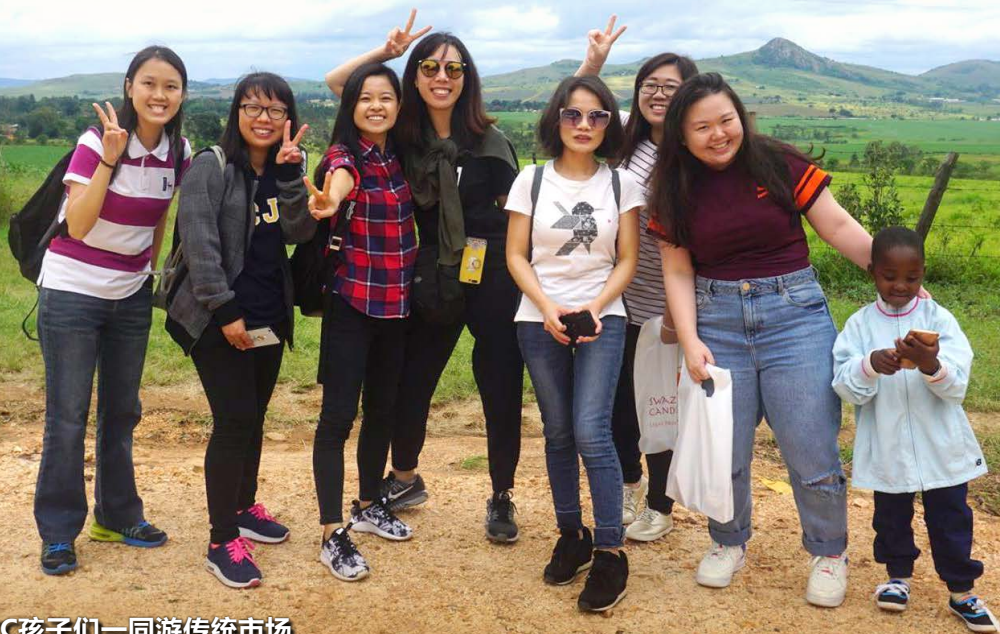
和ACC孩子们一同游传统市场