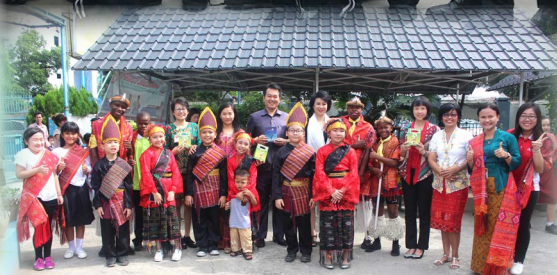
Carneige School按照印尼传统 习俗接待来自非洲的朋友们