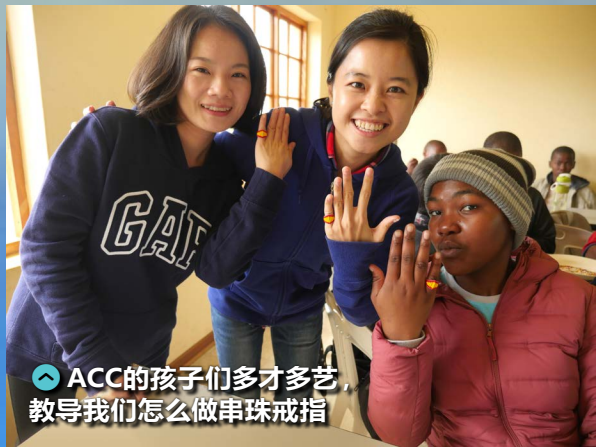
ACC的孩子们多才多艺，教导我们怎么做串珠戒指

曾经在一本书上看过这么一句话“从前的快乐比较快乐”。十天的史瓦帝尼之旅，我似乎真的体验到“从前的快乐”。一个还未完全开发的国度，蕴涵了在城市中消失已久的蓝天白云、绚烂星空，以及孩子们天真爽朗的笑声。