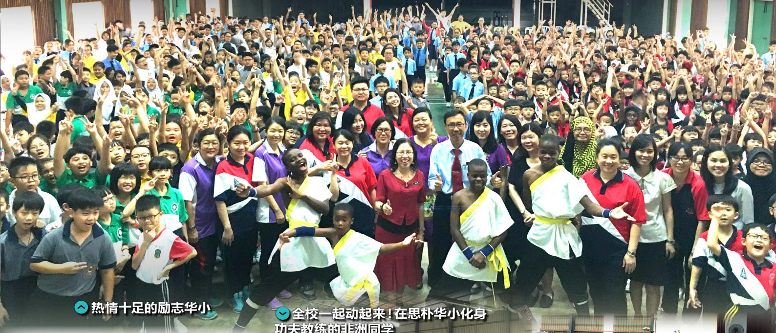
热情十足的励志华小