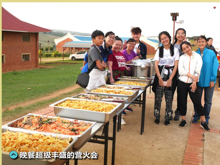
晚餐超级丰盛的营火会