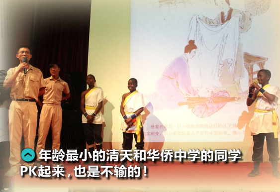
👉 年龄最小的清天和华侨中学的同学PK起来，也是不输的！