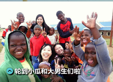
轮到小瓜和大男生们啦

最后一晚的营火会，小瓜们和大孩子们都很难得的能够在户外和朋友们一边吃饭一边聊天。其中和我们相处了几天的孩子们，更主动为我们演唱了几首歌曲，道出他们对我们的不舍之情。离开院区的那天早上，天又像我们抵达院区的第一天，开始下起绵绵细雨。大家都依依不舍地拥抱、道别；当我们乘搭的车子驶出院区，孩子们都聚集在大门向我们挥手道别时，我才发现自己已经和他们建立起了感情。