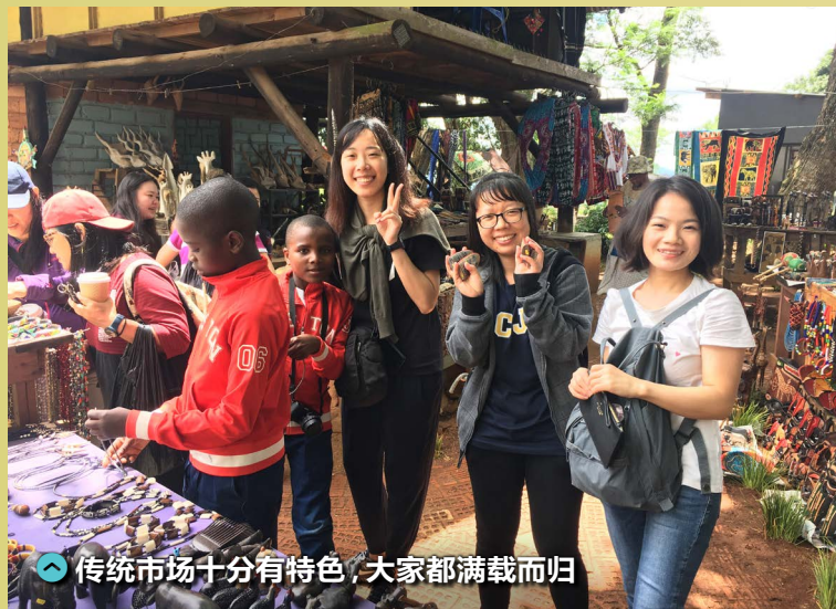
传统市场十分有特色，大家都满载而归

时候会直接‘抓’几个孩子和我们一起踢球、玩跷跷板。其实，孩子们需要的更多是陪伴，而不只是物质上的需求。往后三至四天的行程里，我们离开了院区，到达靠近市区的地方住宿、参观野生动物园和纪念馆。我很感恩，因为这长达十天的旅程都有彼此的照应、谅解！